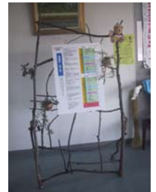
剪定枝を利用した案内板

グリリバ会場内の机、ベンチ、遊具などは国産材マーク基準に合格した国産材製の物が使用されます。